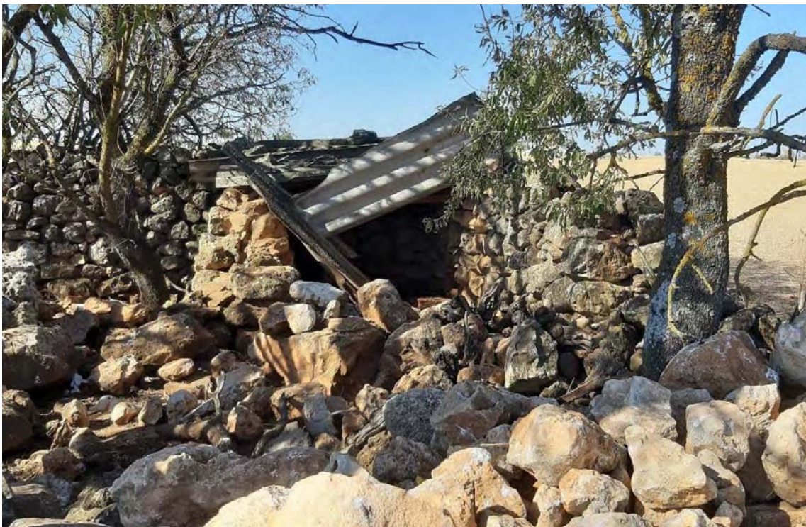
Vista del Chozo la Maldición tras la prospección arqueológica de cobertura total para proyecto de en la PSFV de Mástil Solar.