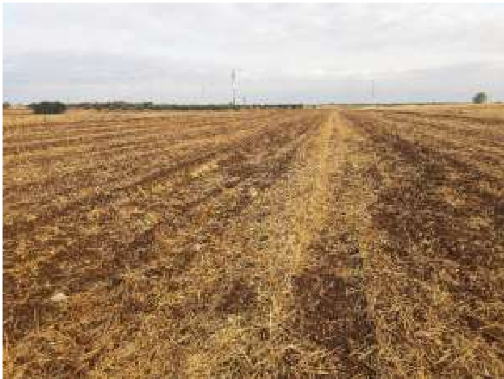
Vista de las parcelas tras la prospección arqueológica de cobertura total para proyecto en ST Rececho.