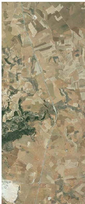
Ortofotografía de la ubicación de ST Rececho.