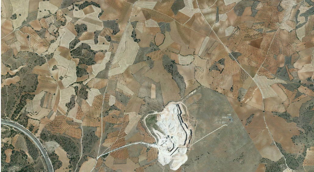
Ortofotografía de la ubicación de PSFV de Driza Solar.