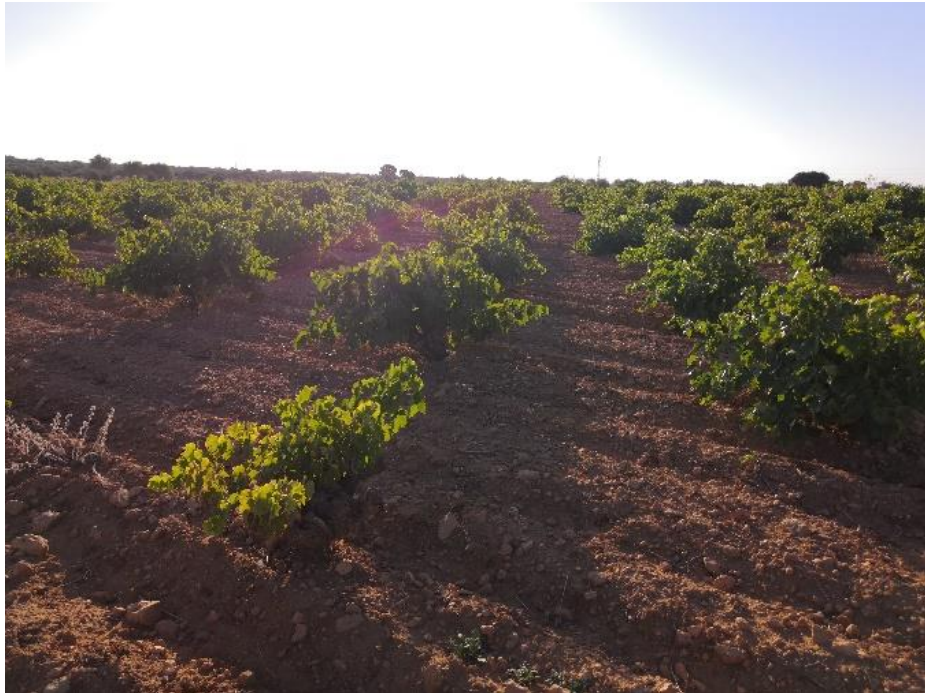
Vista de las parcelas tras la prospección arqueológica de cobertura total para proyecto de en la PSFV de Driza Solar.