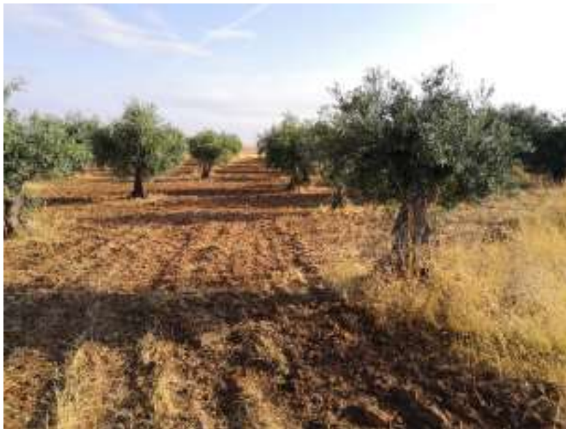
Vista de las parcelas tras la prospección arqueológica de cobertura total para proyecto en ST Rececho.