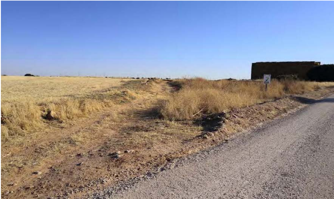
Vista de El Cordel de las Merinas o de la Galiana tras la prospección arqueológica de cobertura total para proyecto de en la PSFV de Mástil Solar.