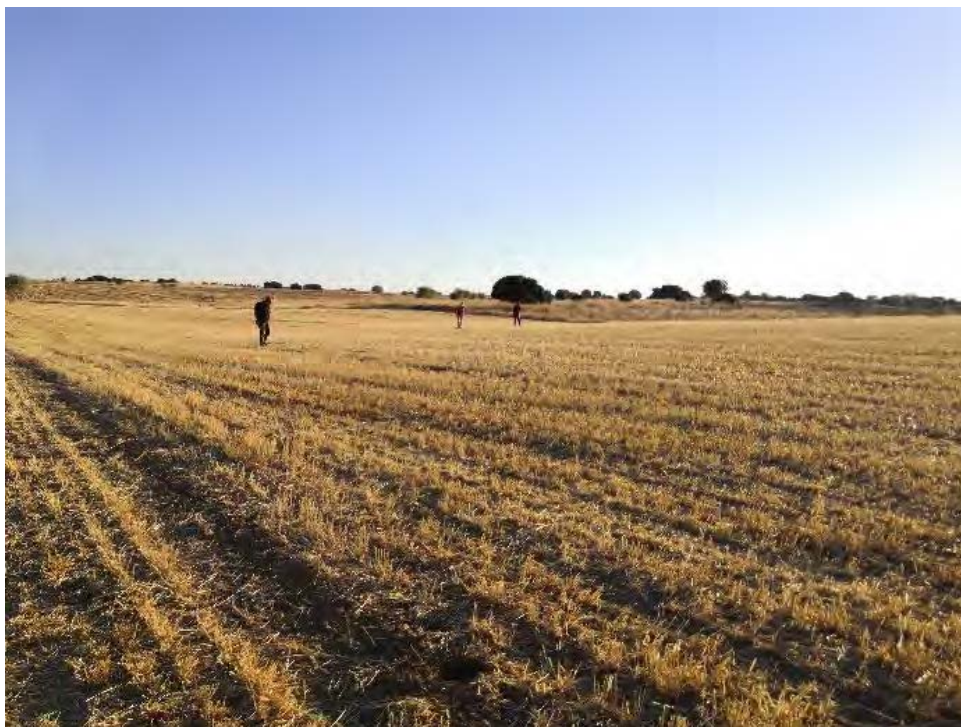
Vista de las parcelas tras la prospección en la zona del yacimiento La Calera para proyecto de en la PSFV de Mástil Solar.