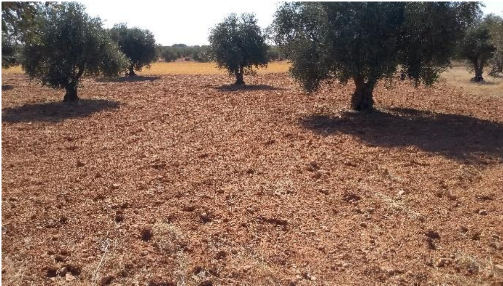
Vista de las parcelas con dispersión de industria lítica "Corral del Gallego" en la PSFV de Driza Solar.