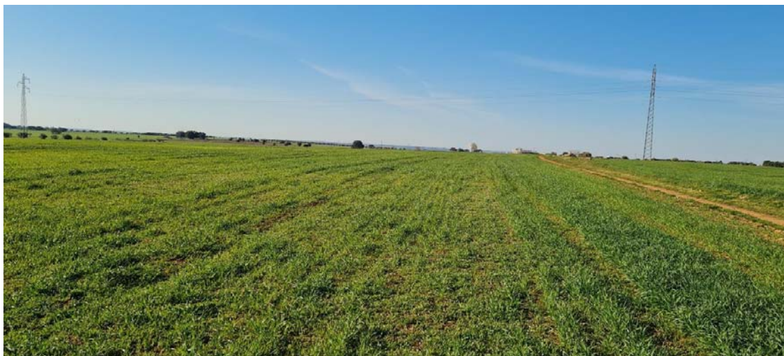
Vista de las parcelas tras la prospección arqueológica de cobertura total para proyecto en la LAAT Rececho-AP 39 Piñon.