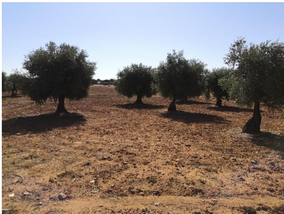
Vista de las parcelas tras la prospección arqueológica de cobertura total para proyecto de en la PSFV de Driza Solar.