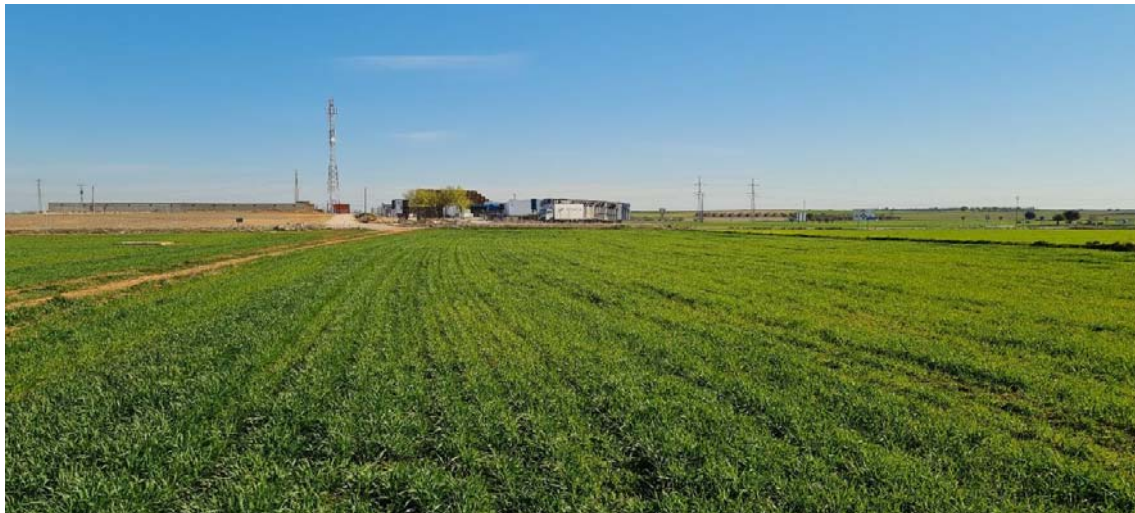
Vista de las parcelas tras la prospección arqueológica de cobertura total para proyecto en la LAAT Rececho-AP 39 Piñon.