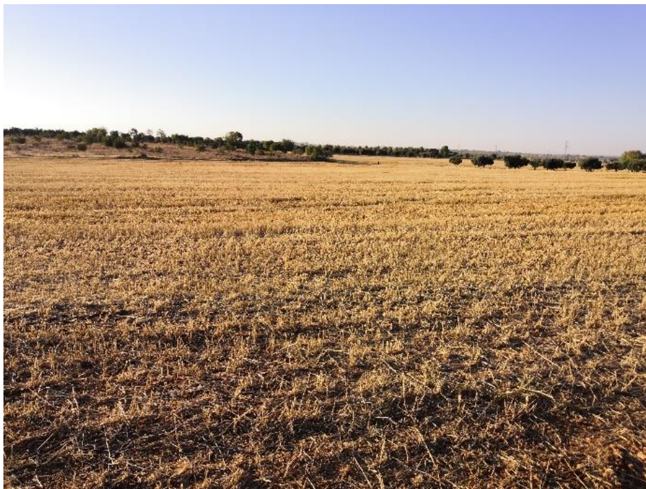
Vista de las parcelas tras la prospección arqueológica de cobertura total para proyecto de en la PSFV de Driza Solar.