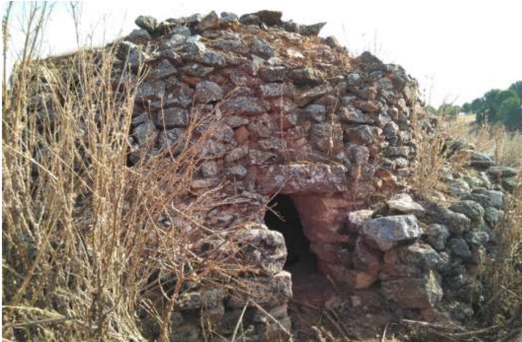
Vista de La Calera tras la prospección arqueológica de cobertura total para proyecto en ST Rececho.